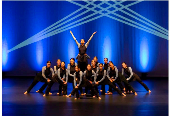
„Das Elly tanzt“