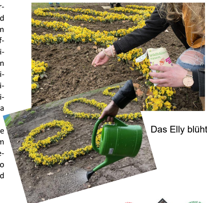
Das Elly blüht auf!